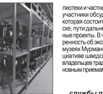
4. Фондохранилище музея Норботтена

Участники конференции также посетили церковный город Гаммельштад (Gammelstad kyrkstad), внесенный в Список культурного наследия ЮНЕСКО в 1996 году. В XIV—XVII веках город Луллео располагался в другом месте, рядом с церковью Nederlulea, построенной в 1492 году и являющейся самой большой на севере Швеции каменной церковью. В состав объекта входят сама церковь, 408 традиционных церковных домиков-коттеджей, в которых размещались шведы во время посещения церкви, и коттеджей, свезенных сюда со всего Норботтена; частные дома и приходское зернохранилище. Сотрудники музея под открытым небом Хэгниан (Hagnan), расположенного вблизи с церковным городком Гаммельштад, провели экскурсию с привидениями в старом городе, которая удивила нас хорошей идеей и качественной профессиональной работой.