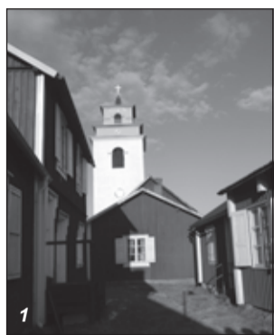
1. Церковный городок Gammelstad