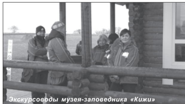
Экскурсоводы музея-заповедника «Кижы»

17 августа — День Кижской волости на о. Кижы. На празднике соберутся потомки старинных заонежских родов, жители исторических деревень Кижской волости. Состоится мирской