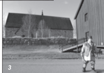
3. Программа «Призраки церковного городка»