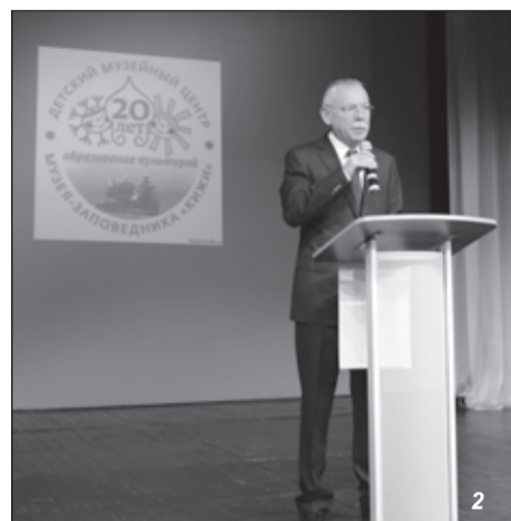
Центра развития образования. Занятия для детей дошкольного возраста, презентация которых прошла в детском саду №108,

Первыми были презентованы занятия, посвященные 300-летию Преображенской церкви на о. Кижь, в номинации «Кижский архитектурный ансамбль — выдающийся памятник деревянного народного зодчества, объект Всемирного наследия ЮНЕСКО». Авторы поделились своими разработками, находками и интерактивными заданиями по памятникам архитектуры о. Кижь. Этими материалами смогут воспользоваться педагоги республики при проведении тематических классных часов и уроков, посвященных 300-летию Преображенской церкви, в День знаний 1 сентября: тексты занятий будут представлены на сайтах музея «Кижь», Министерства образования РК,