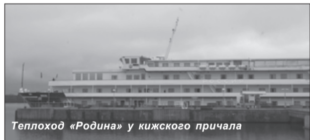
Теплоход «Родина» у кижского причала

Наступает лето, открылась навигация, начался очередной сезон, и на остров Кижы потянулись туристы. 9 мая в День Победы на остров пришёл первый в этом году теплоход с американскими туристами. Клетному сезону 2014 года музей «Кижы» обновил и расширил свое экскурсионное предложение. В дополнение к основной экскурсии разработаны тематические маршруты, отвечающие запросам людей с разными предпочтениями.