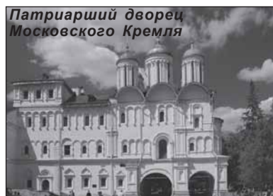
Патриарший дворец Московского Кремля

Один из самых важных вопросов повестки дня — проблемы взаимодействия России и ЮНЕСКО. Обсуждали их именно в Кремле неслучайно — ведь он стал одним из трех первых объектов на территории еще Советского Союза, внесенных в Список Всемирного наследия. Теперь таких объектов в России — двадцать четыре. И каждый ставит перед учёными свои задачи. Один из самых «больших» вопросов — сохранение этих памятников, их научная реставрация, а также историческая среда вокруг них.