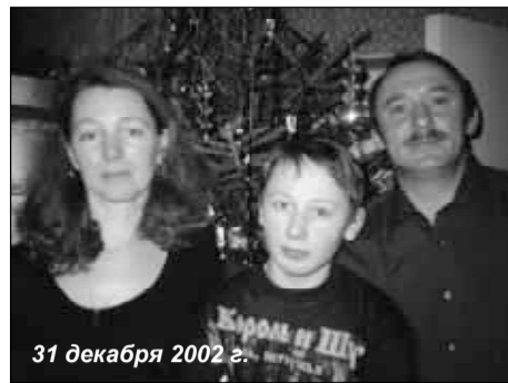
31 декабря 2002 г.