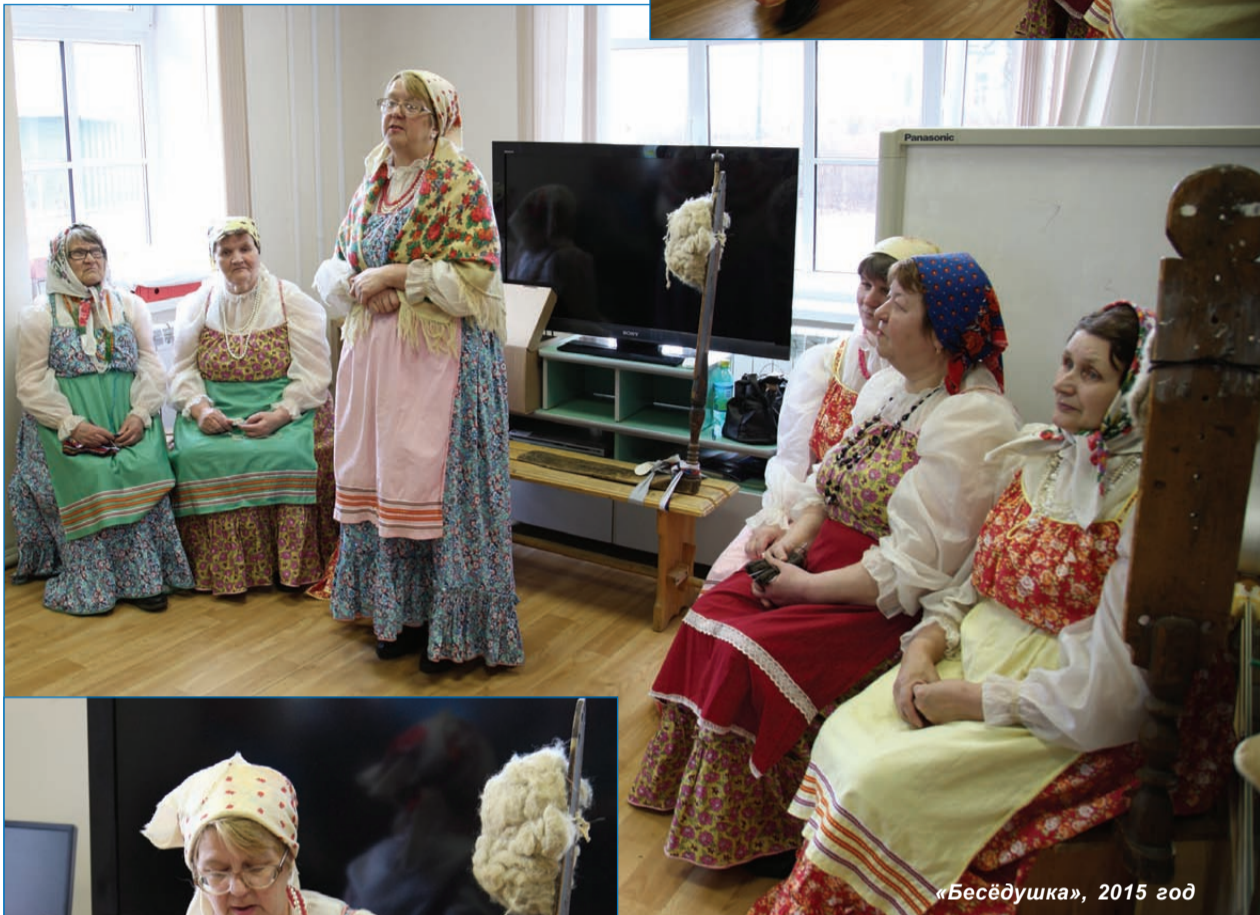
«Бесёдушка», 2015 год