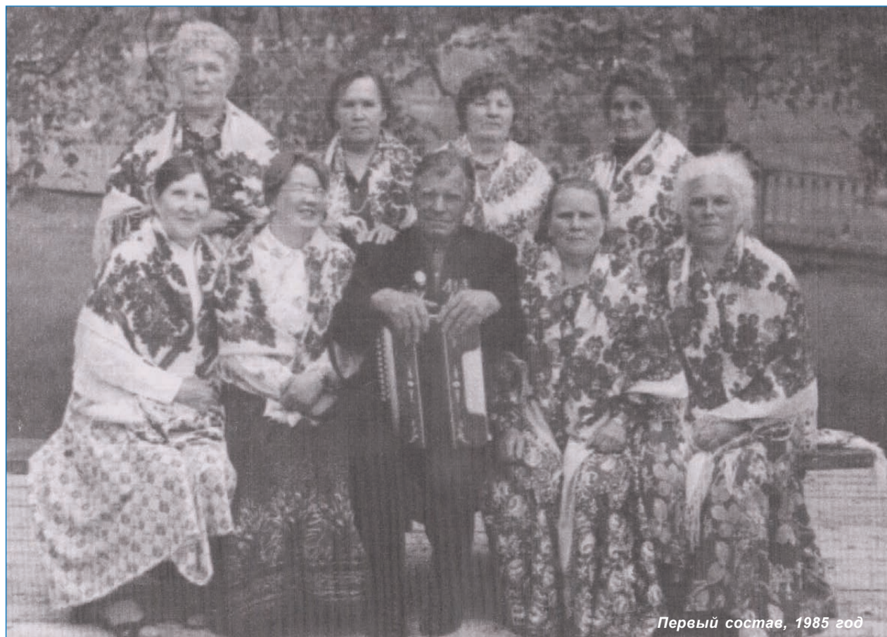
Первый состав, 1985 год