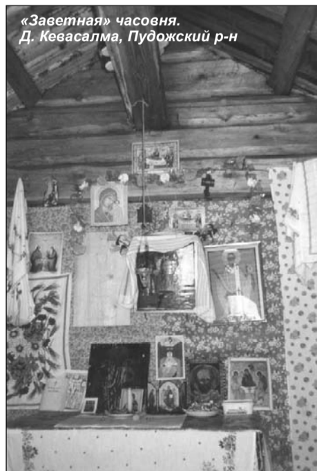
«Заветная» часовня. Д. Кевасалма, Пудожский р-н

На погосте отмечали и большинство великих православных праздников: Рождество, Крещение и т.д. Особенно любили Пасху.