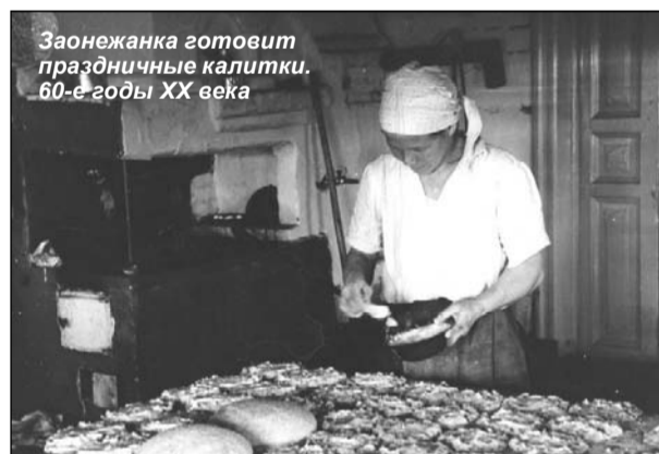
Заонежанка готовит праздничные калитки. 60-е годы XX века

в основном «кадриль» танцевали, «ланцого» танцевали под гармошку... Гармонист у нас был один на всю волость. Это Гриша «реченский» (из д. Речка). По тем временам он был хороший самоучка-гармонист. Его приглашали вот так на домашние вечера, когда собирались молодежь, интеллигенция собиралась, все учителя собиралась».