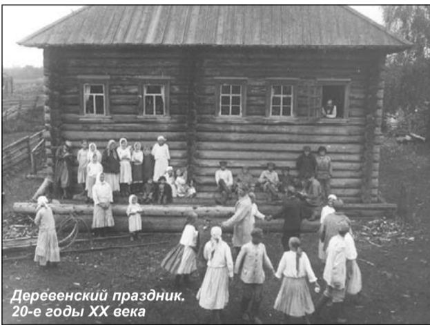
Деревенский праздник. 20-е годы XX века

А с Покрова до следующей Пасхи службы велись в зимнем храме. В Заонежье за Покровом закрепилось символическое начало зимы. «В Покров — первое зазимье. На Покров земля снегом покрывается, морозом одевается», — говорили в народе. По погоде этого дня судили о предстоящей зиме. Дата была переломной и в хозяйственном отношении: заканчивался пасту-