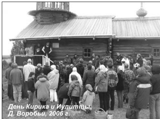
День Кирика и Иулитты. Д. Воробы, 2006 г.

В самый сенокос справляли праздник, на поженке танцевали. Торговали товарами: гребенками, брошками, конфетами. «Конфеты делали в д. Кузнецы, длинные как карандаши. Ребята все у родителей просили этих конфет». Гулянье устраивали в д. Середка. «Много молодежи собиралось, танцевали. Ну,