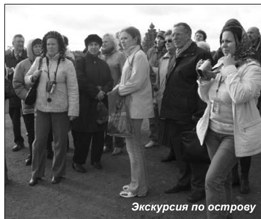
Экскурсия по острову

ренция очень полезна, так как здесь собираются люди смежных специальностей. Все, что здесь услышишь, наверняка больше нигде не прочитаешь. Здесь я пообщалась с коллегами из Сыктывкара, что в обычное время сложно и порой невозможно. Хочу сказать спасибо сотрудникам музея, которые организовали нам такой праздник души».