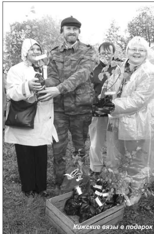
Кижские вязы в подарок