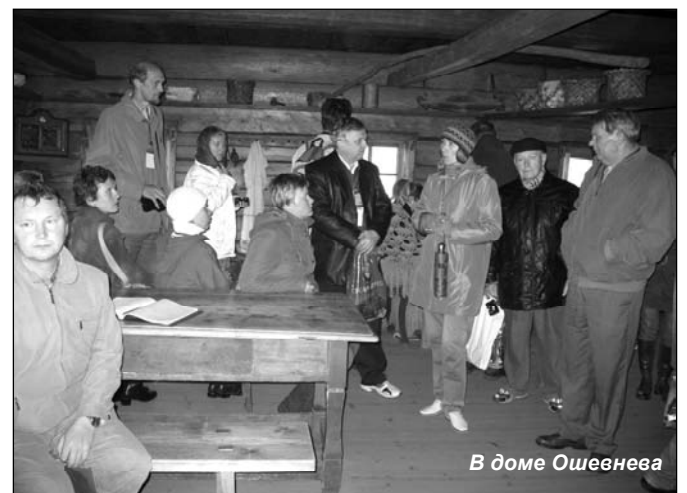
В доме Ошевнева