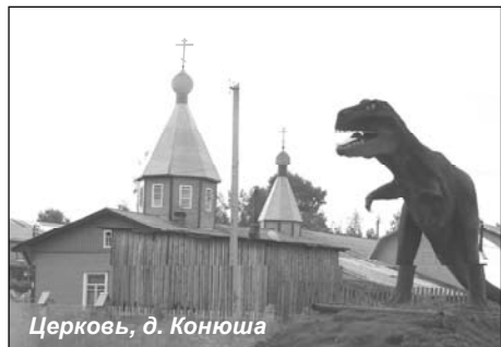
Церковь, д. Конюша

С таким обоснованием этим летом, в июле, совместная экспедиция отделов фондов и истории и этнографии выехала для работы в Каргопольском, Плесецком, Няндомском и Коношском районах теперешней Архангельской области — прежде эти четыре района были одним Каргопольским уездом Олонецкой губернии. Забегая вперед, можно сказать, что нам удалось поработать в «активном поиске» во всех этих четырех районах. Были белые ночи, но все равно времени очень не хватало, работали допоздна, спали мало. Если бы нам еще те четыре дня, на которые сроки нашей экспедиции сократили, то результаты работы наверняка были бы гораздо большими.