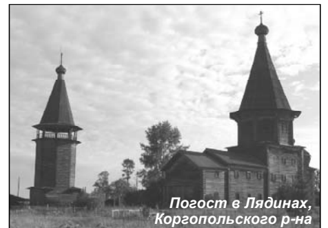
Погост в Лядинах, Каргопольского р-на