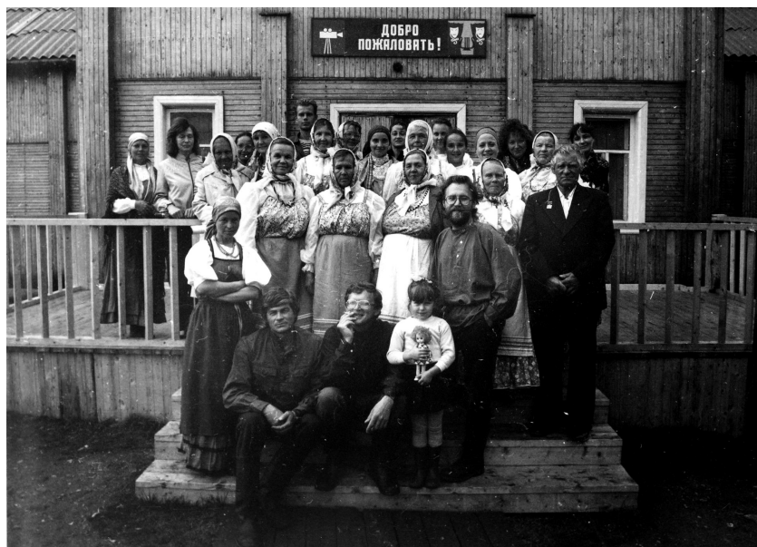
Фольклорная группа музея «Кижь» в поселке Ламбасручей с участниками местного фольклорного коллектива. Фото 1991 г.