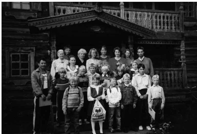
Ученики Кижской школы с учителями и родителями.