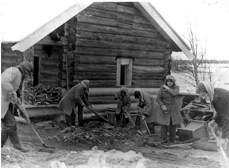
Субботник по подготовке к летнему сезону. О. Кижы. Фото 1970 г.