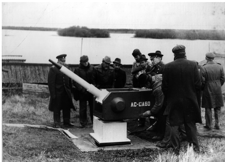
Техническое совещание по пожарной безопасности на Кижском погосте. Фото начала 1980 гг.